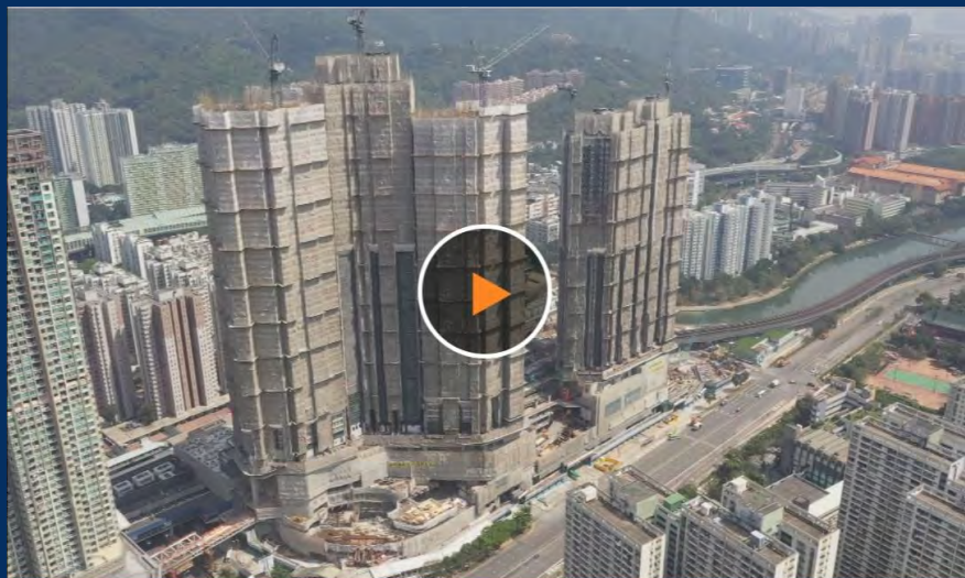
新盤柏傲莊收票逾2.2萬張